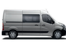
Furgon - duplakabin