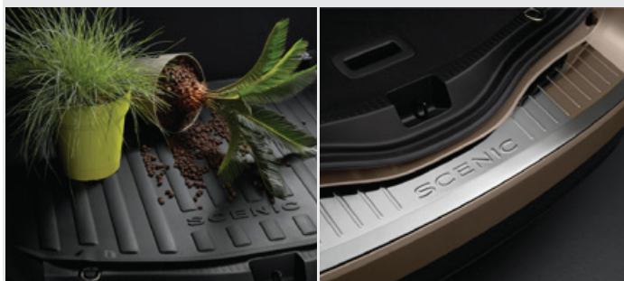
Csomagtér tálca, csomagtér küszöbvédő 40 990 Ft

** Az akciós bruttó tartozék-csomag árak tartalmazzák a tartozékok fel- és beszerelésének ajánlott bruttó munkadíját is.