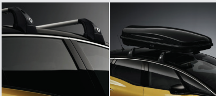
QuickFix tetőrudak (2 db), tetőbox (630 l) 184 990 Ft