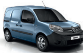
Üstökös kék (RNL)*