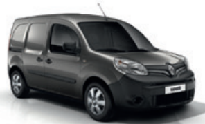
Kassziopeia szürke (KNG)*