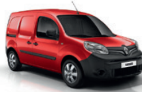
Élénk piros (719)