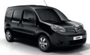
Fekete metál (GND)*