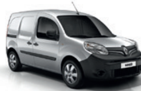
Ezüst szürke (KNX)*