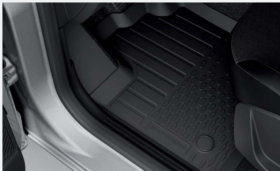
Hattyúnyakos vonóhorog, gumiszőnyeg